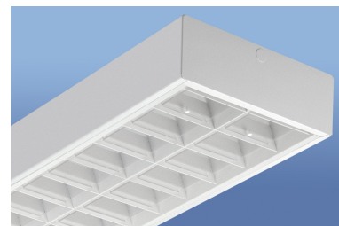
Leuchtenfarbe: ähnlich RAL 9016