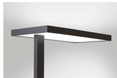
Leuchtenfarbe: Tiefschwarz strukturlack