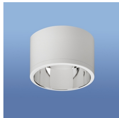
Leuchtenfarbe: ähnlich RAL 9016