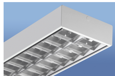
Leuchtenfarbe: ähnlich RAL 9016