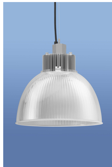
Leuchtenfarbe: Weißaluminium matt